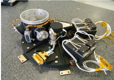
Roue à filtres d'ASTRO-H

La roue à filtre a été développée et fabriquée par la société Ruag Space (ZH), sur la base d'un concept initial développé à l'Université de Genève. L'électronique de contrôle a été conçue par la société Micro-Cameras & Space Exploration (MCSE, NE). La fabrication de l'électronique a été prise en charge par l'Université de Genève.