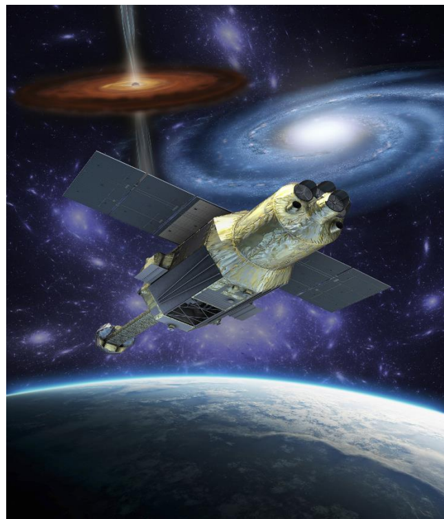
Vue artistique du satellite ASTRO-H

http://global.jaxa.jp/press/2015/12/20151211_h2af30.html http://astro-h.isas.jaxa.jp/en http://global.jaxa.jp/projects/sat/astro_h http://www.cosmos.esa.int/web/astro-h http://astroh.unige.ch http://www.ruag.com/space/ruag-space-switzerland http://www.microcameras.ch